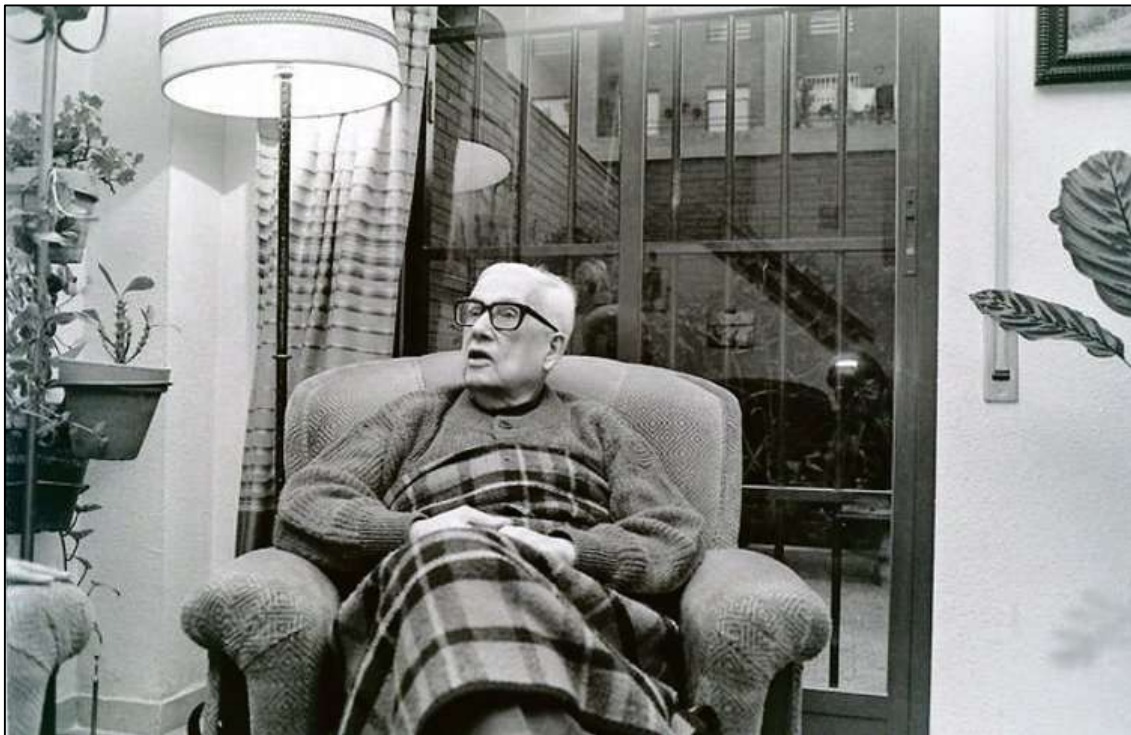
IMAGEN 4: EL PADRE LLANOS EN SU CASA