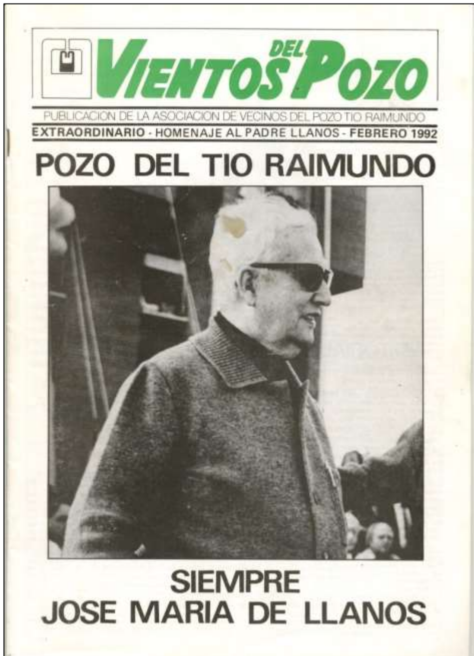
IMAGEN 6: HOMENAJE AL PADRE LLANOS EN "VIENTOS DEL POZO", PUBLICACIÓN DE LA ASOCIACIÓN DE VECINOS DEL POZO TÍO RAIMUNDO (FEBRERO DE 1992)