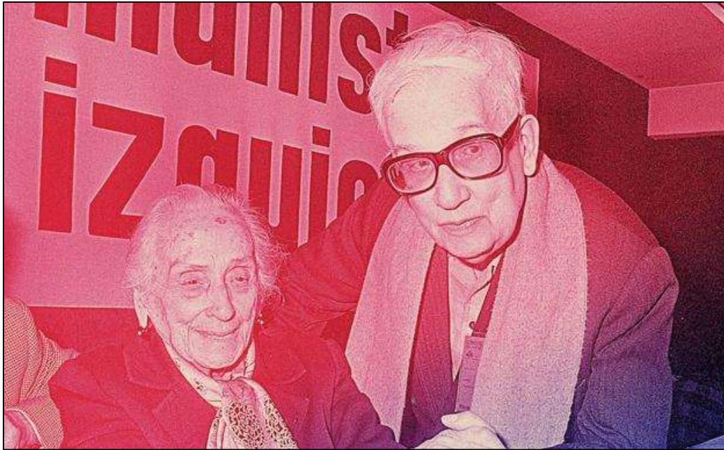
IMAGEN 3: EL PADRE LLANOS CON DOLORES IBÁRRURI, "LA PASIONARIA"