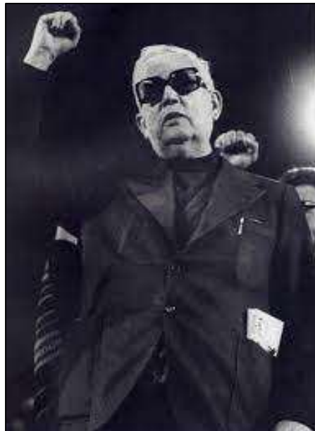
IMAGEN 1: EL PADRE LLANOS EN EL MITIN DEL 27 DE MAYO DE 1977 EN EL ESTADIO DE VALLECAS