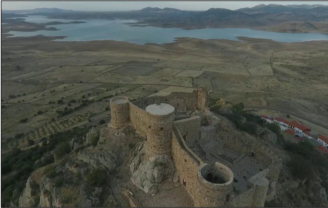
Emplazamiento del castillo de Capilla, al fondo el embalse de La Serena.

El cerro del castillo no es, sin embargo, el de mayor altura de la zona, a apenas 600 metros se encuentra el Peñón del Pez que alcanza los 660 metros de altura en el que se encuentran restos de fortificaciones de época romana-republicana. Hacia el Sur la propia Sierra del Palenque (de la que el cerro del castillo forma parte) que alcanza una altura máxima sobre el nivel del mar de 700 metros, y al Oeste la Sierra del Torozo, con 846 metros de altura.