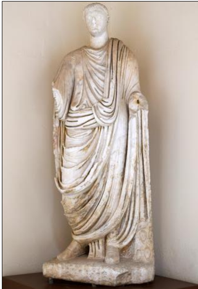
Togado de Capilla.

Durante la etapa de dominación romana los recursos mineros de la zona, principalmente mercurio, que eran conocidos mucho antes, fueron explotados de forma intensa, constituyendo además una importante zona de paso que conectaba los importantes yacimientos mineros del Norte y Sur peninsular. Para optimizar el control de la zona y sus recursos en un territorio todavía inestable desde el punto de vista político, los primeros asentamientos romanos se ubicaron en zonas altas, es el caso del Peñón del Pez, situado a apenas unos 600 metros del actual núcleo urbano de Capilla; de este poblado hay que reseñar sus impresionantes murallas construidas con mampuestos ciclópeos trabados en seco con ripios, y dispuestas en tramos escalonados aprovechando la roca natural del terreno. Con la llegada de la Pax Augusta los poblados se trasladaron de los altos a los llanos, donde se facilitaba su control, este parece ser el caso de Miróbriga, cuya población se establece en el Cerro del Cabezo. Las excavaciones arqueológicas datan este poblado entre finales de la etapa republicana (S.I a.c.) y el Siglo II d.c. Destaca de esta época el togado que se encuentra en el Museo Arqueológico Provincial de Badajoz.