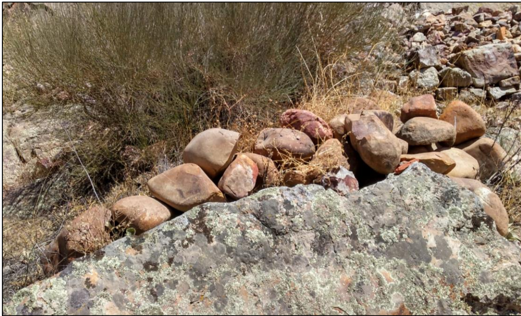
Bolos de río (interpretados como proyectiles) apilados durante las excavaciones arqueológicas del castillo.

A pesar de momentos en que los cristianos conseguían grandes avances, incluso hay un episodio en que los templarios consiguen tomar la plaza para perderla inmediatamente después, y del importante castigo sufrido, la alcazaba de Kabbal consigue resistir, hecho al que contribuyó la marcha de parte de los efectivos castellanos a otros conflictos más al norte.