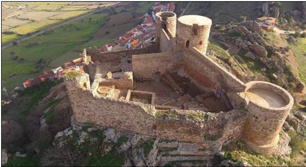
Imagen aérea del Castillo de Capilla.