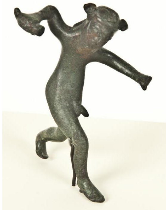
Sileno de Capilla.

Durante la Edad del Hierro destaca el yacimiento de La Tabla de las Cañas, originalmente junto al río Zújar y que hoy se encuentra sumergido bajo las aguas del embalse de La Serena. Allí apareció el "Sileno de Capilla", pequeña figura de bronce de influencia griega que representa a un sátiro danzante relacionado con la difusión del comercio del vino en los banquetes funerarios; la figura se encuentra en el Museo Arqueológico Nacional, en Madrid.