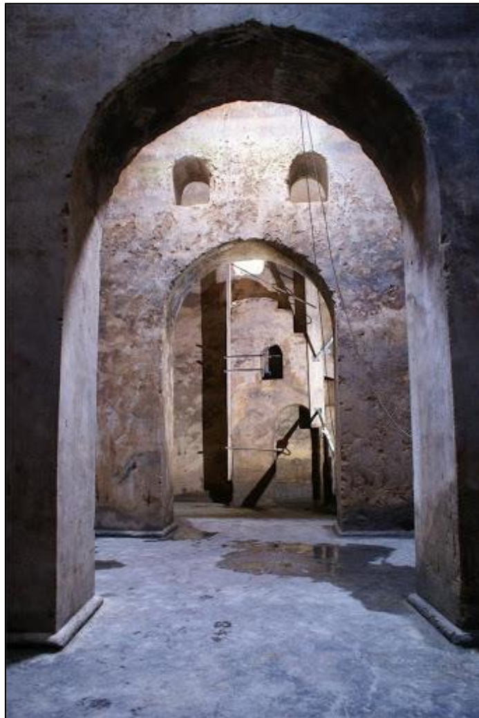
Aspecto del interior del aljibe del castillo tras finalizar su excavación.

En el estudio del estrato de fango que se encontraba en el fondo se ha documentado una gran cantidad de material cerámico del siglo XV, monedas, armas, objetos de uso cotidiano, semillas, huesos de frutos, etc.