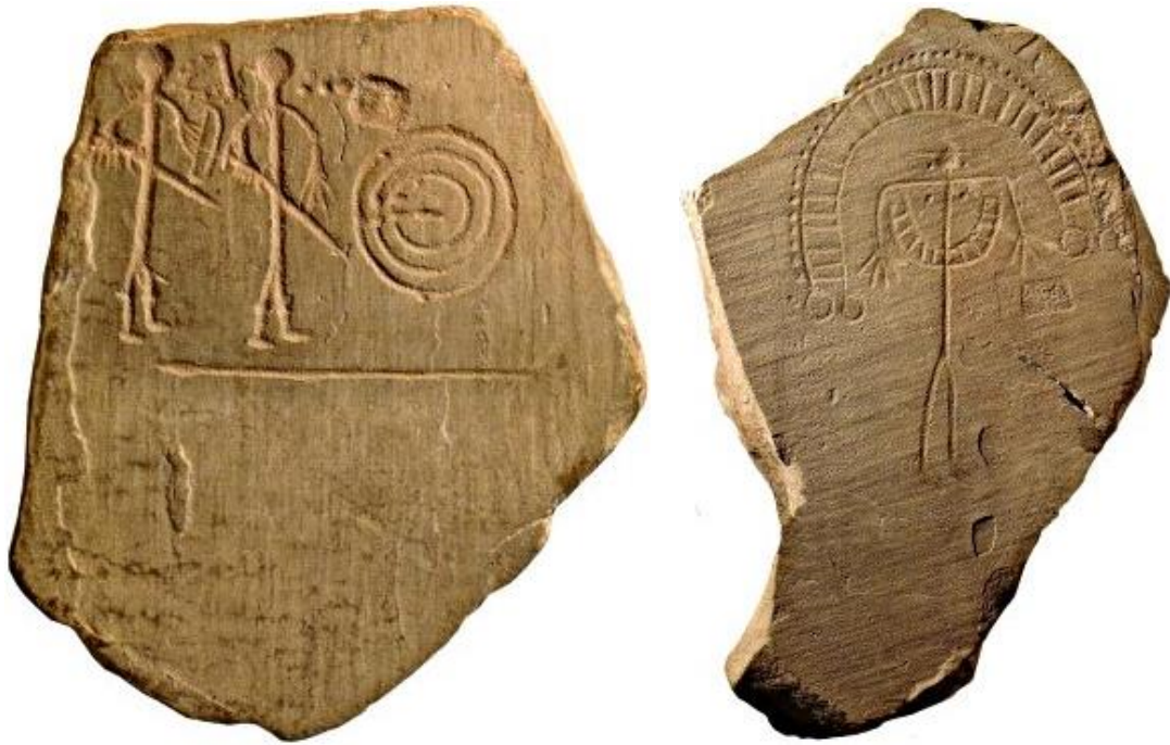
Estelas de Capilla. A la izquierda estela de guerrero, a la derecha estela diademada.

estelas sigue siendo un misterio, tal vez funeraria, tal vez servían para marcar la zona controlada por un determinado grupo, vías de comunicación o de paso, etc.