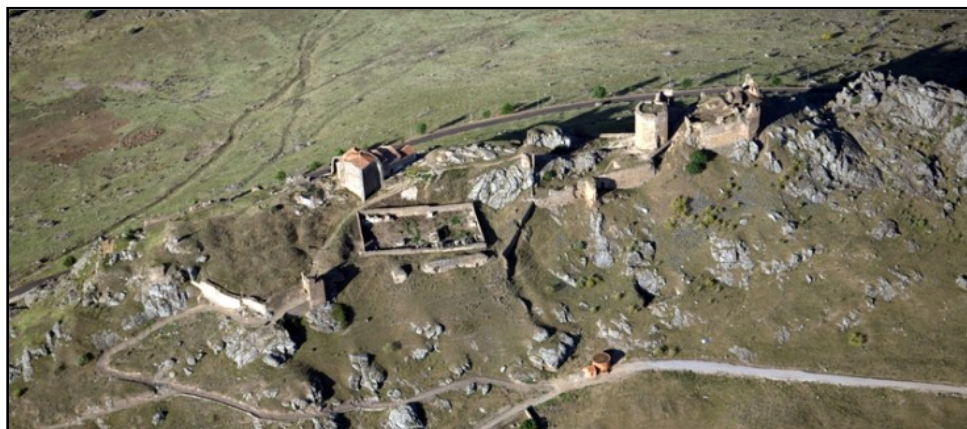
IMAGEN 8. VISTA AÉREA DEL CASTILLO DE MAGACELA