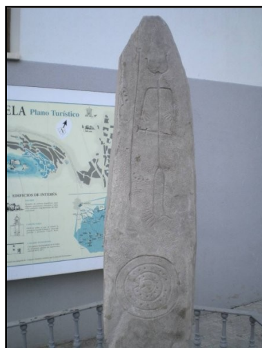
IMAGEN 7 REPRODUCCIÓN DE LA ESTELA