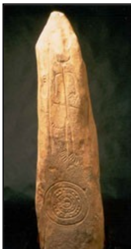
IMAGEN 6 ESTELA DE GUERRERO DE MAGACELA