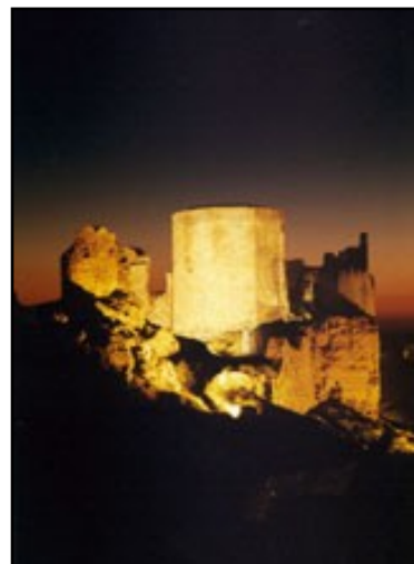
IMAGEN 10 TORRE DEL HOMENAJE