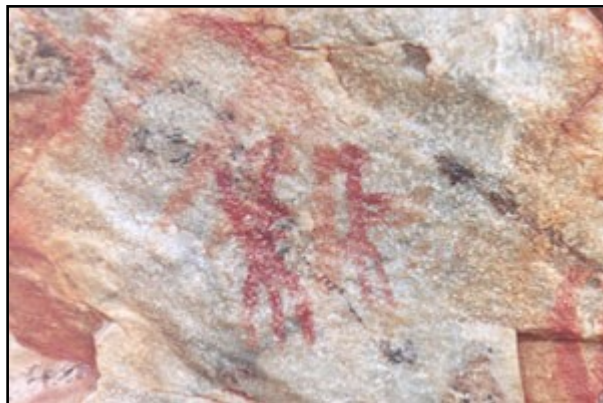
IMAGEN 2. FIGURA ANTROPOMORFA