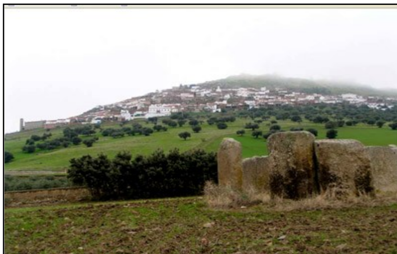
IMAGEN 4. DOLMEN DE MAGACELA (CON LA LOCALIDAD AL FONDO)