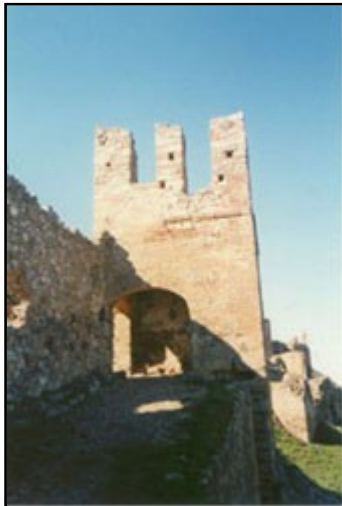
IMAGEN 9 PUERTA DE SAN PEDRO