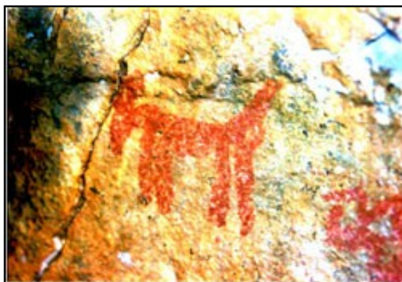
IMAGEN 3. FIGURA ANTROPOMORFA