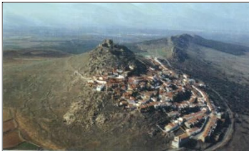
IMAGEN 1. VISTA AÉREA DE MAGACELA